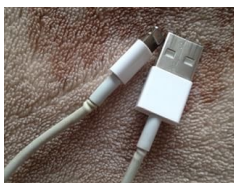
Dobles (chins) indican daño interno