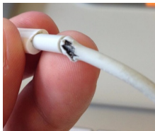
Un corte o rotura obvia en la cobertura plástica

Las multas por TODOS los cables / cargadores dañados serán calculados a la Entrega.